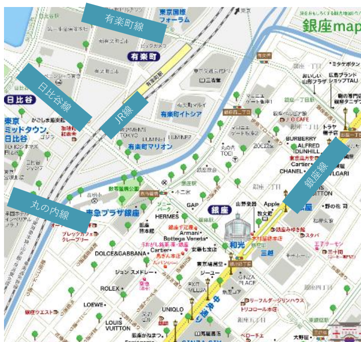
■有楽町駅 1日当たり乗降客数 * 25年は推計 (JR線、東京メトロ有楽町線 合計)

有楽町駅はJR線と東京メトロが乗り入れており、25年度の1日当たりの乗降客数は27万人（19年度比 78%）となっています。コロナ後、徐々に回復傾向にあります。