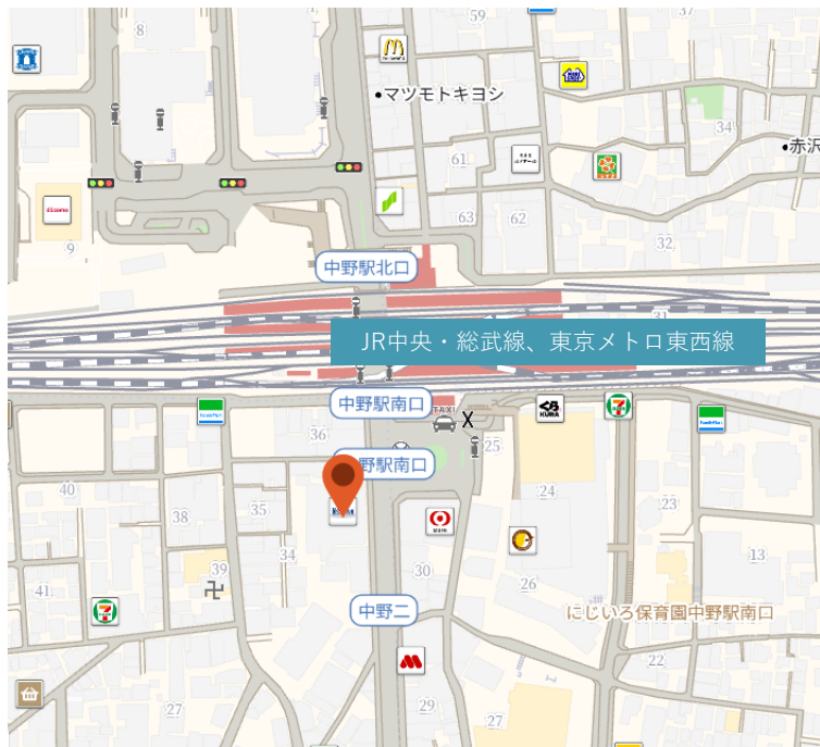
■中野駅 1日当たり乗降客数 *25年は推計 (JR中央・総武線、東京メトロ東西線 合計)

総武線と東京メトロ東西線が乗り入れる、東京西側エリア有数の主要ターミナル。 近年の大学進出やオフィス開発、駅周辺再開発を背景に、乗降客はコロナ前水準へ回復