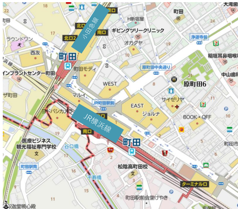
■町田駅 1日当たり乗降客数 *25年は推計 (小田急小田原線、JR横浜線 合計)

小田急線・JR横浜線の2路線が交差する、東京・神奈川境界エリア最大の広域拠点。駅周辺に多くの学校を抱え「学生の街」の側面もあり、若年層中心とした駅利用者は着実に回復