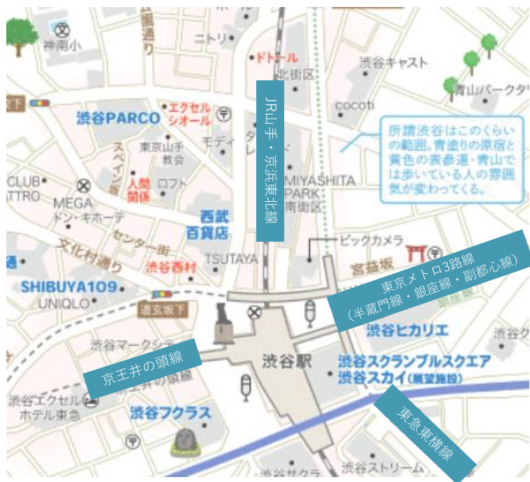
■渋谷駅 1日当たり乗降客数 *25年は推計 (JR各線、東急2路線、東京メトロ3路線、京王井の頭線 合計)

渋谷駅は9路線が集中する世界最大級のターミナル。再開発プロジェクトにより、ビジネス・商業機能が飛躍的に拡充。広域からの集客力はコロナ前水準をほぼ回復