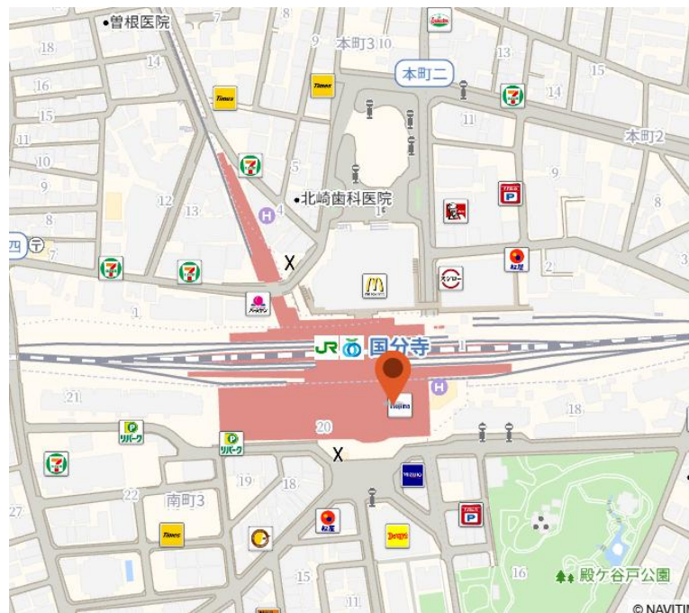
■国分寺駅 1日当たり乗降客数 *25年は推計 (JR中央線、西武国分寺線・多摩湖線 合計)

JR中央線の特快停車駅であり、西武線2路線が乗り入れる多摩地域の主要ターミナル。駅直結の利便性と豊かな居住環境を背景に、乗降客数は19年比95%の水準まで堅調に回復