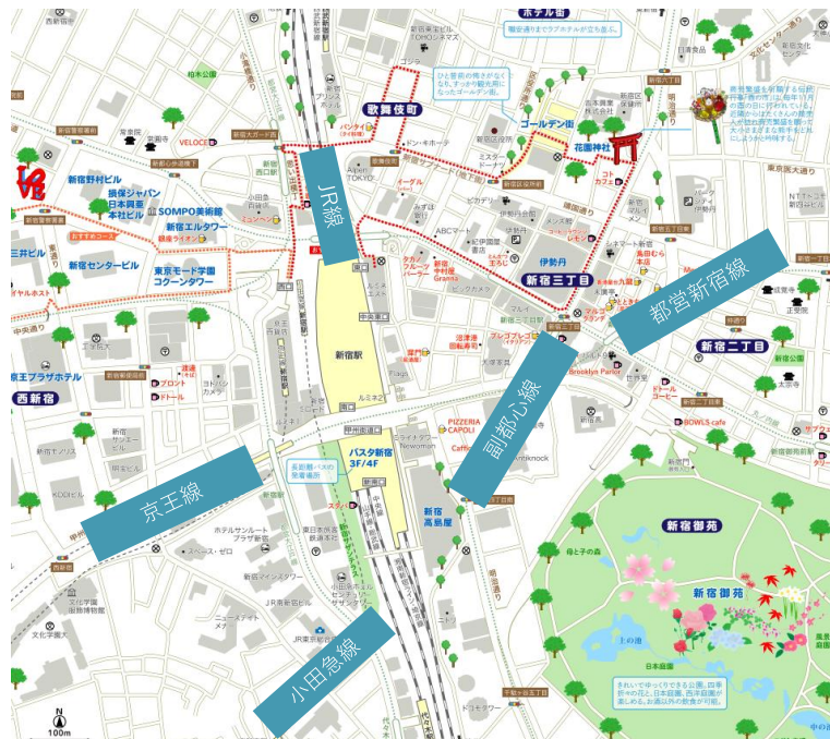
■新宿駅・新宿3丁目駅 1日当たり乗降客数 *25年は推計 (JR東日本・京王線・小田急線・東京メトロ・都営地下鉄 合計)